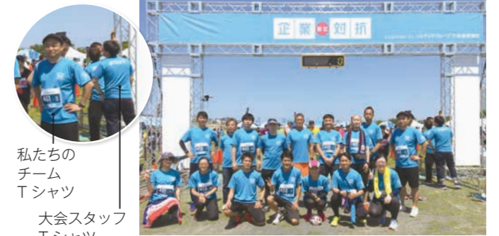
私たちのチームTシャツ 大会スタッフTシャツ

新しい仕事のパートナーとの出会いをたくさん頂けた事で今年は例年に無く充実した気持ちで会場を後にし、また来年も参加しようと思ったのでした。