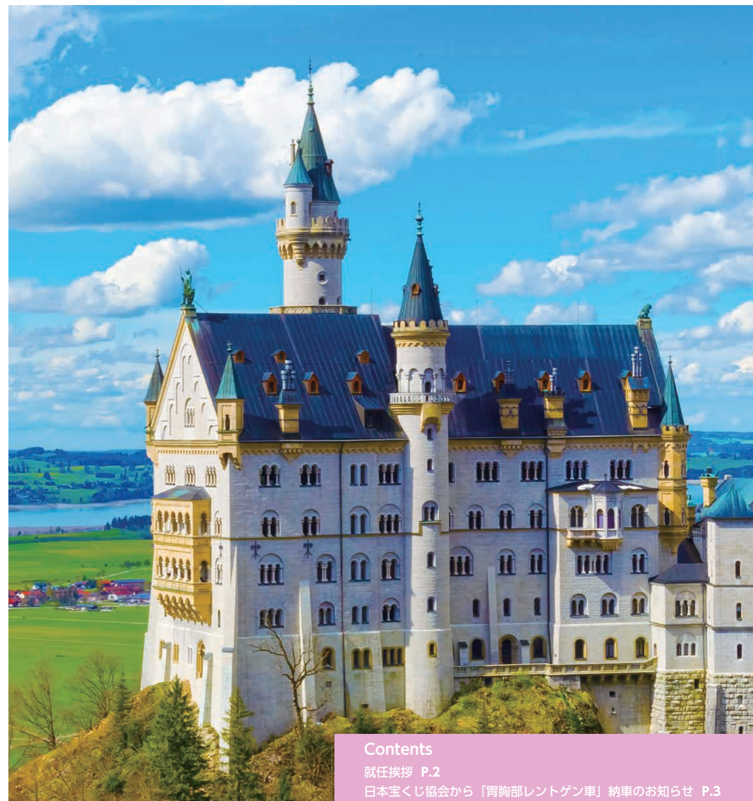
ノイシュヴァンシュタイン城